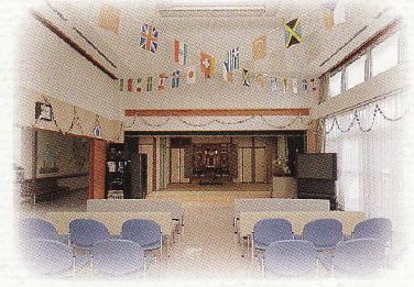
ふれあいの間・娯楽室