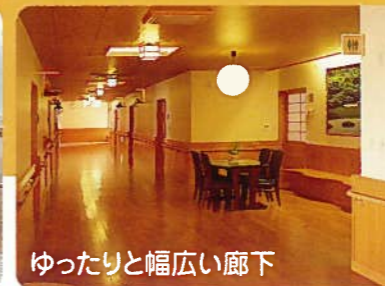
ゆったりと幅広い廊下