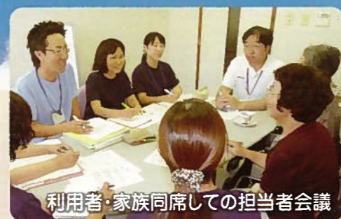
利用者・家族同席での担当者会議