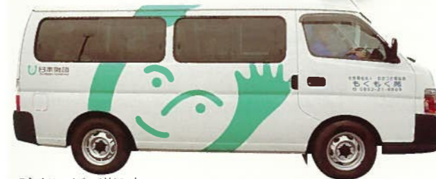
デイサービス送迎車