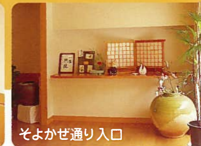
そよかぜ通り入口